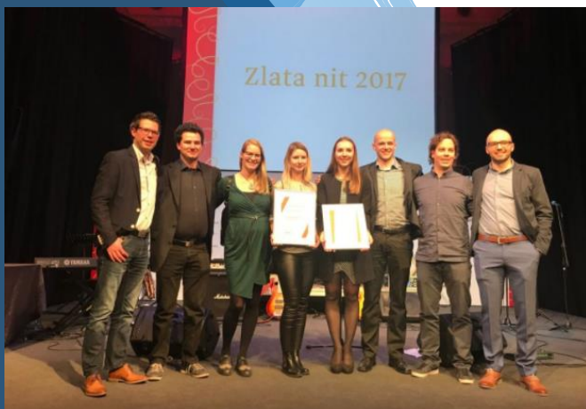
Nagrada Zlata nit, 2017