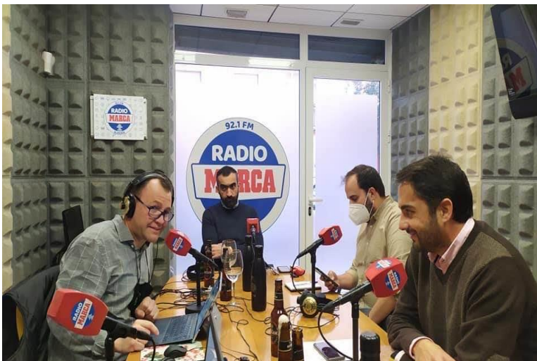
Nuestro equipo en un programa de radio