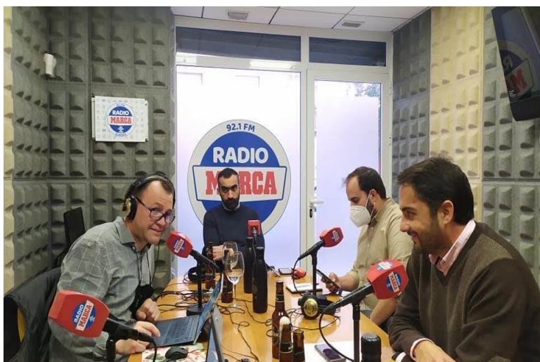
Нашият екип в радио предаване