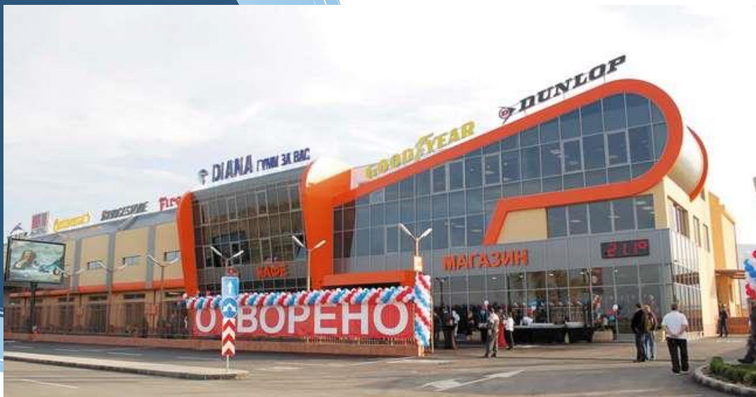
Obchod s pneumatikami DIANA v Sofii